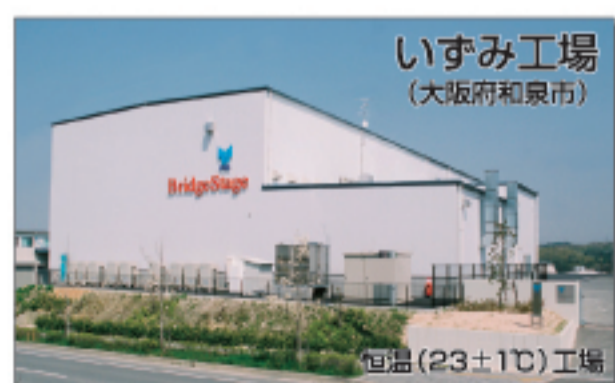
いずみ工場 (大阪府和泉市)