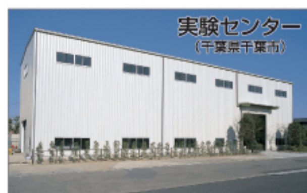
実験センター (千葉県千葉市)