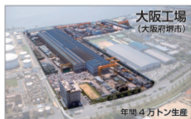
大阪工場 (大阪府堺市)