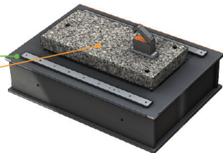
温度変化に強い複合構造定盤